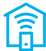
Smart Home, Smart Building

Oventrop ist der Partner für effizientes Wärmen, Kühlen und sauberes Trinkwasser. Die modularen Systeme und Services bieten wegweisende Lösungen, mit denen alle SHK-Profis flexibel und einfach arbeiten – von der Planung über das Handwerk bis hin zu Industrie und Handel. Als Familienunternehmen begleitet Oventrop seine Partner kompetent und persönlich, über viele Jahre.