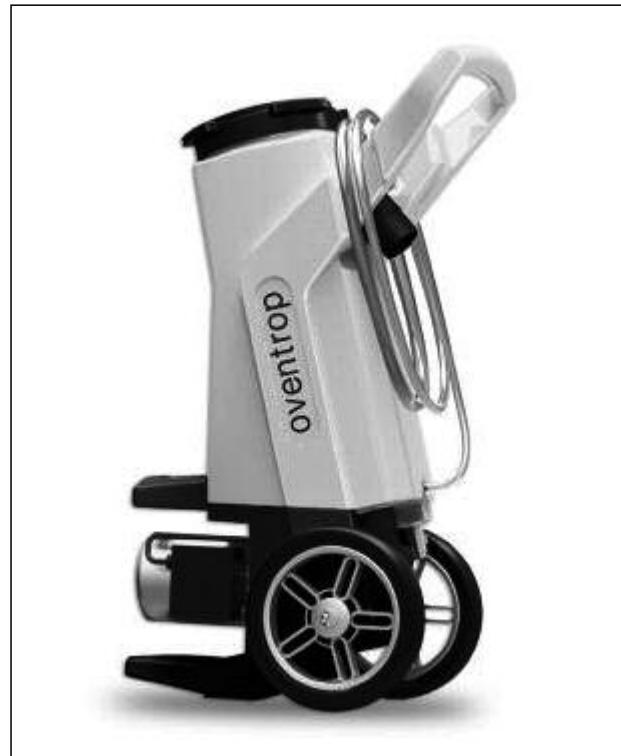
„Regusol“ Spül- und Befüllstation