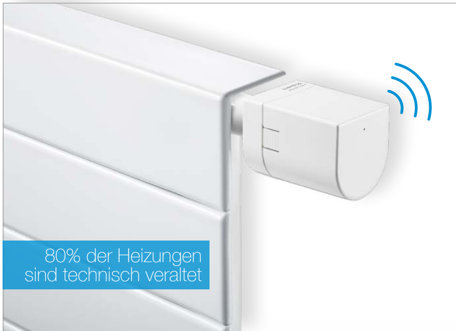
„mote 420“ Funk-Stellantrieb: Raumtemperturregelung auf die smarte Art

Ein smartes Zuhause erleichtert den Alltag und steigert den Wohnkomfort.